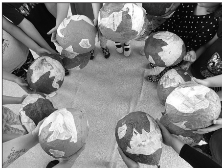
22. 4. 2021 oslava Dne Země