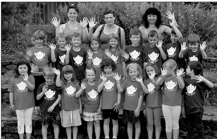
23. 6. 2021 Předškolní maturita